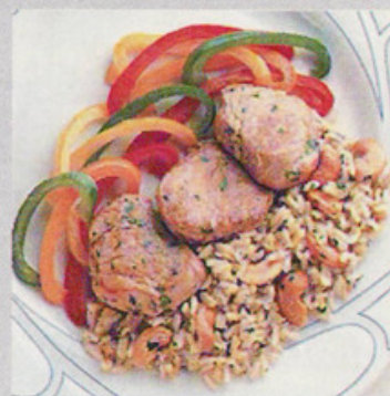
Рецепта: Печено свинско върху подложка от ориз

Хранителна информация за 1 порция: Калории: 510,78; Белтъчини: 33,37; Въглехидрати: 31,24; Мазнини: 27,97 Категория: Ястия с месо Подкатегория: Свинско Порции: 6 Време за подготовка: 25 мин. Време за готвене: 40 мин.